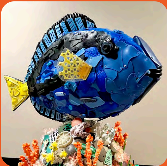
Presenta BERNIE THE ROYAL BLUE TANG

Traído por el Dillons, Rotary Club of Topeka, Security Benefit, Visita Topeka y Envista Credit Union.